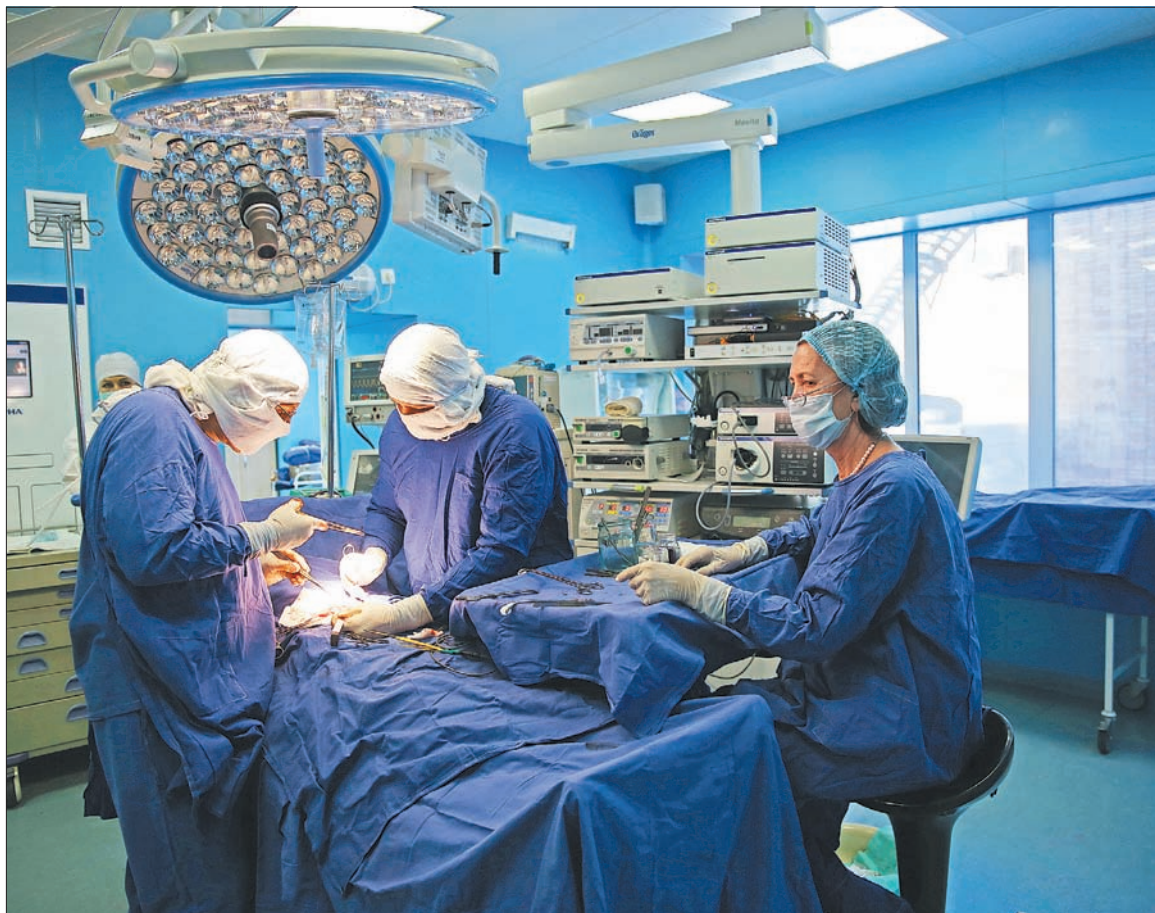
Растет объем оказания высокотехнологической медицинской помощи. В 2016 году ВМП получают 15000 жителей Самарской области. Это более чем на треть больше, чем в 2014 году