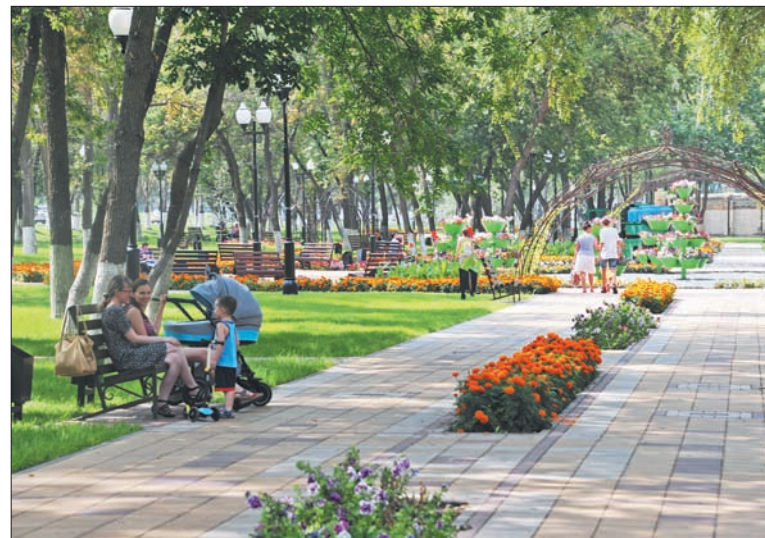
И если мы выйдем все как один, мы сделаем Самару такой, которой потом долгие годы все жители будут гордиться

Очень важна здесь поддержка наших традиционных конфессий, а также землячества разных народов, давно проживающих в Самарской области.