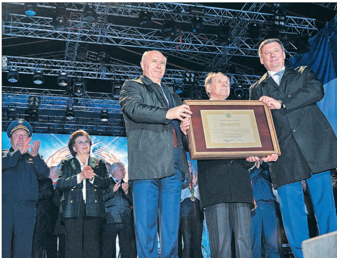
В 2016 году произошло знаменательное, по сути, историческое событие. Президент Российской Федерации Владимир Владимирович Путин поддержал нашу инициативу по присвоению Самаре почетного звания «Город трудовой и боевой славы»

19 ребенка. За последние 15 лет – почти на 5 лет. Сейчас этот возраст составляет 28,45 года. Это уже показатель, сравнимый с показателями западных стран. Поэтому одна из главных наших задач – сделать все, чтобы первый ребенок родился раньше. Тогда и возможности второго родить больше, а может быть, и третьего. А если возраст и дальше будет повышаться – у нас проблем будет еще больше.