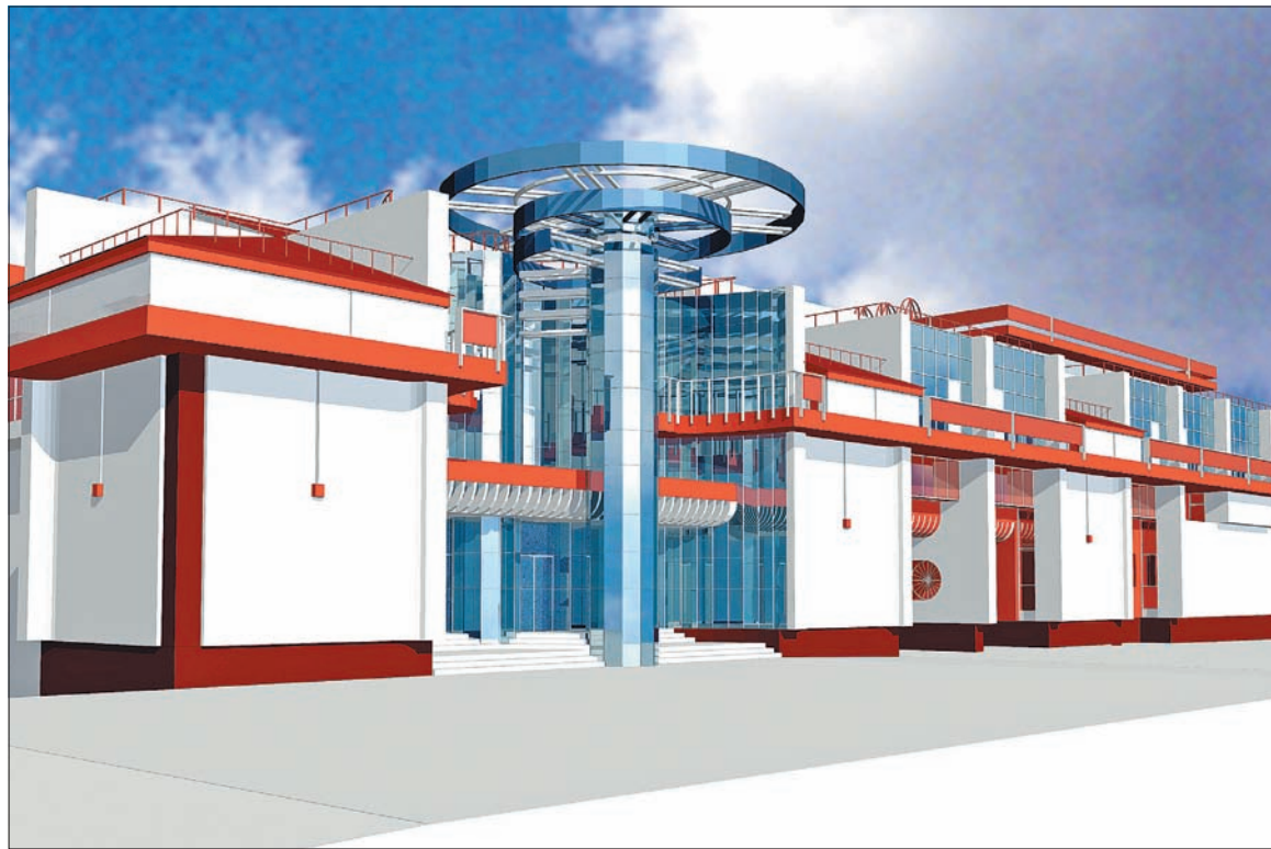
Завершается строительство не имеющего аналогов в стране Самарского театра юного зрителя «СамАрт» с залом-трансформером на 480 мест

Но далеко не все услышали тот сигнал, который был подан еще в 2012 году. В департаменте по делам молодежи за два года расходы на управление выросли на 14%, в секретариате правительства - на 21%. А в целом 11 из 40 органов государственной власти Самарской области увеличили свои расходы на управление. И на местах тоже не все услышали. Я имею в виду муниципалитеты. Хочу сказать, что все допустившие увеличение расходов на управление бу-