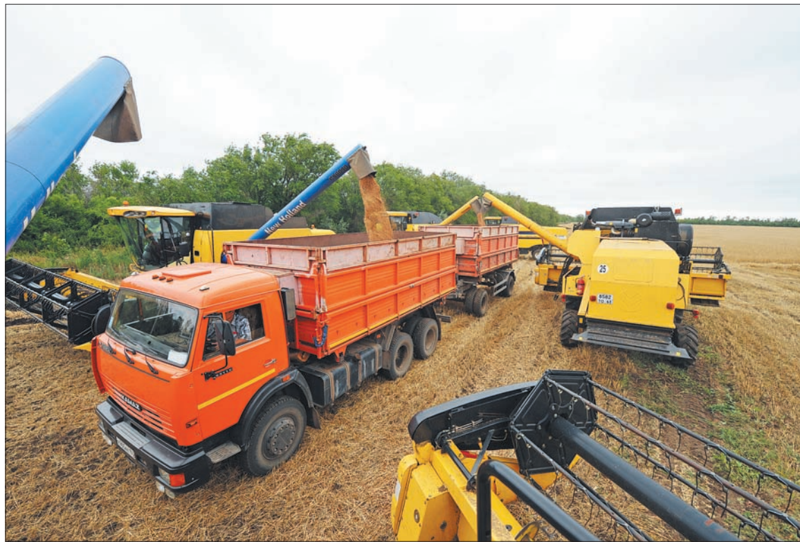
Земледелие стало одним из самых прибыльных видов деятельности, с рентабельностью до 60 процентов. Это позволило получить нашим аграриям 8 млрд рублей прибыли. Выросла средняя зарплата в АПК

Сетевым компаниям надо в ускоренном режиме обновлять сети. И мы не можем уродовать дороги. У нас только в этом году в Самаре 454 аварийных вскрытия асфальтовых дорог. 120 вскрытий в Тольятти. Мы не можем так работать в пред-дверии Чемпионата мира, когда порывами и утонувшими в кипятке машинами даем повод нашим оппонентам показы-вать такое лицо нашей области и страны. Поэтому летом этого года мы должны практически везде на основных направле-ниях здесь разобраться и вмес-те с собственниками привести все в порядок.