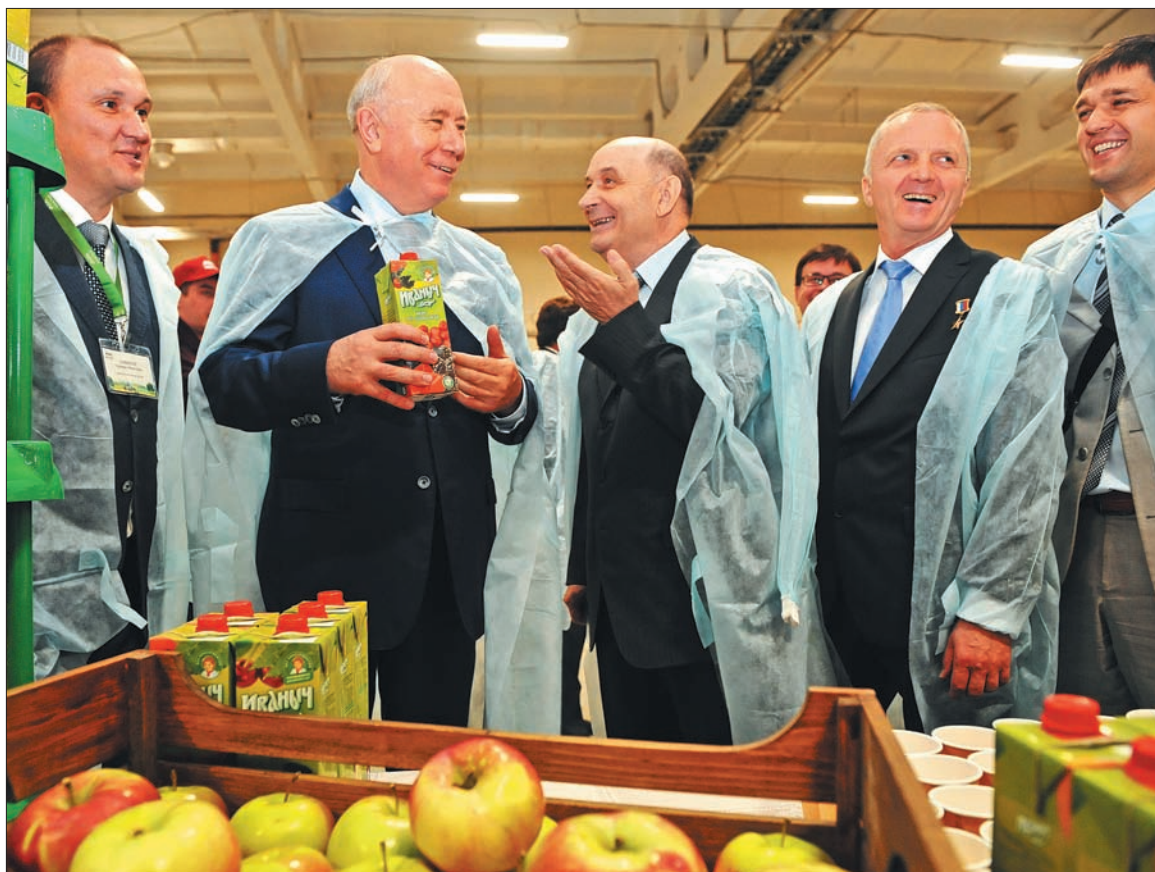
В уходящем году мы открыли крупный завод «Нектар» по производству соков на собственном сырье. И нам совместно с собственником надо сделать все, чтобы занять очень солидную долю рынка в стране и работать на экспорт

и кукурузу на зерно выращивать, сою, картофель, овощи. Картофелем и овощами и садами мы активно занимаемся. Мы тут в стране далеко не последние. Нам надо запустить комбикормовый завод Сергиевской птицефабрики – первый этап фабрики. Нужно начать производство пектина и занимать этот огромный рынок в стране, потому что у нас много зерна. Мы могли бы здесь по зерну получить седьмой-восьмой передел, иметь значительно больше рабочих мест и получать значительно больше доходов.