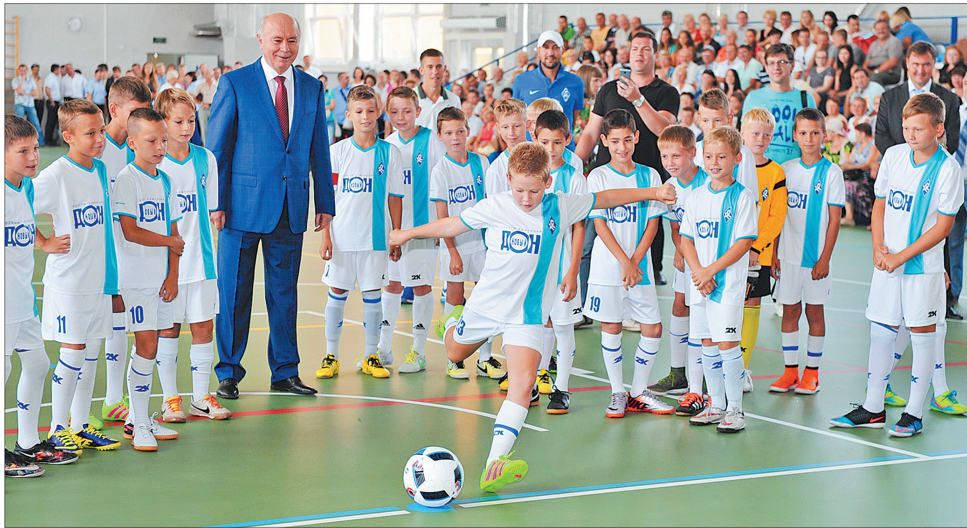
В уходящем году построены и реконструированы: ледовый дворец в Кошках, спорткомплексы в Зубчаниновке, Георгиевке Кинельского района и Нефтегорске, сызранский стадион «Центральный», бассейн в Большой Черниговке

при оценке эффективности работы лечебного учреждения. Или ты рынки завоевываешь, или ты сворачиваешься. И твою нишу будут занимать другие. Или сюда будут деньги приходить, или в другой регион. Повышение конкурентоспособности наших медицинских учреждений, завоевание ими лидерских позиций на межрегиональном, федеральном и международном уровнях – это сегодня не только требование времени, но и главный залог развития, а в перспективе – самого сохранения региональной медицины. Мы, имея такие традиции, таких врачей, если министерство будет правильно понимать задачу и активно работать, можем создать такие центры, куда будут приезжать лечиться со всего мира.