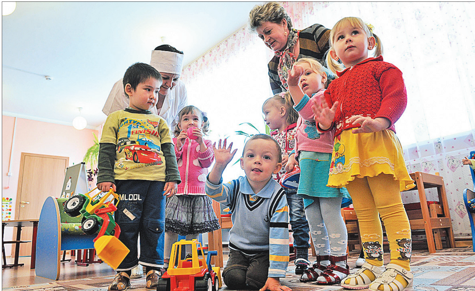
В этом году построено 9 детсадов (в Самаре, Тольятти, Сызрани, Сызранском и Похвистневском районах). Начато возведение 5 новых детсадов (в Крутых Ключах, Волгаре, Южном городе, в Тольятти и в Большой Глушице)