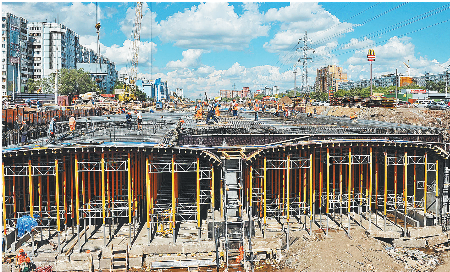
Мы начали строить современные развязки. Многоуровневое движение должно стать устойчивым трендом предстоящего десятилетия