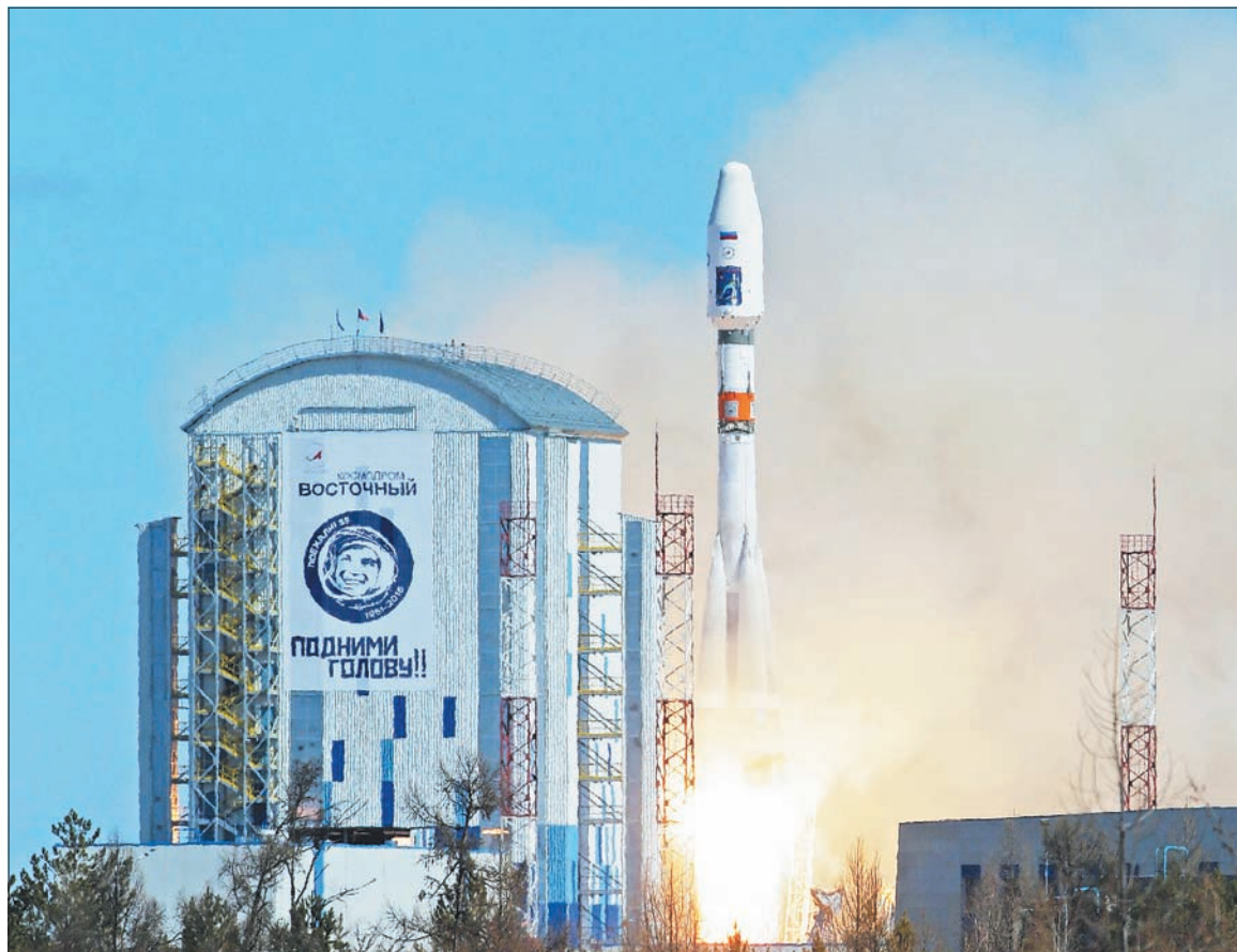
В уходящем году произошло важнейшее событие в целом для страны и, конечно, Самарской области. Состоялся успешный запуск самарской ракеты с первого российского гражданского космодрома «Восточный»

Но мы очень хорошо понимаем, что трудовому коллективу завода пока еще очень и очень тяжело. Это хорошо понимают и акционеры. Они сегодня предпринимая конкретные шаги, и этот процесс сейчас активно идет, которые должны значительно улучшить, в том числе и финансовое положение завода. Мы, область, со своей стороны, делаем все, чтобы поддержать коллектив АВТОВАЗа. В октябре на Сочинском форуме областью, Сбербанком и АВТОВАЗом подписано соглашение о переносе одного из крупнейших подразделений Сбербанка из Москвы в Тольятти, для создания первой тысячи рабочих мест для осваивающихся сотрудников АВТОВАЗа. Область вкладывает в реализацию этого проекта более 300 млн рублей. Это