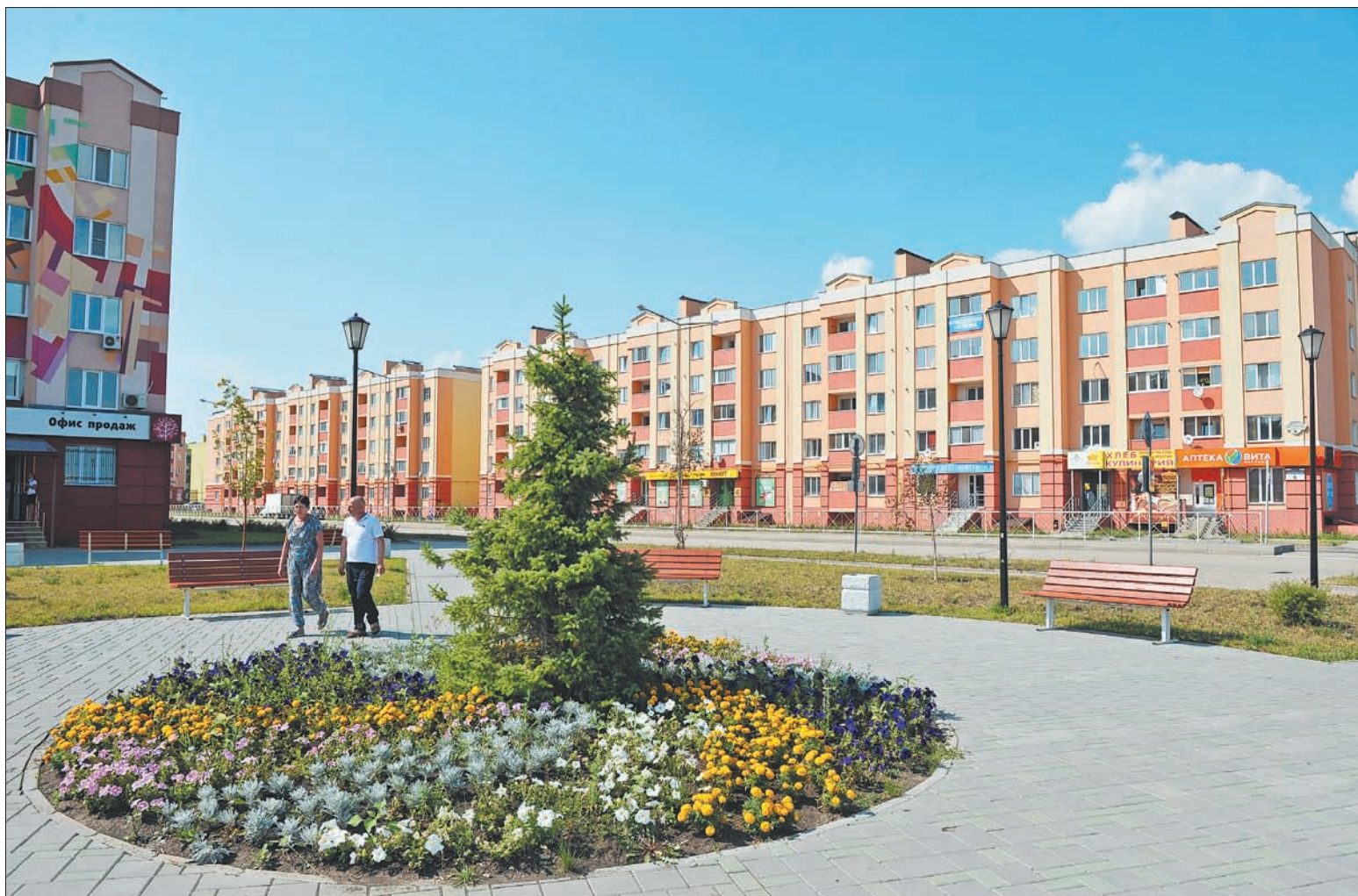
Министр строительства России, Мень Михаил Александрович, рекомендовал в своем выступлении другим регионам самарский опыт комплексной застройки территории

Мы подписали соглашение с банком ВТБ. Он размещает в Самаре свои операционные мощности. Будет создано для начала более 500 рабочих мест для высококвалифицированных специалистов. Это в основном айтишники, программисты, люди, которые хорошую заработную плату получают. Естественно, и для нас исключительно важно, чтобы на этих рабочих местах был высокоинтеллектуальный труд, чтобы эти люди закреплялись в Самаре.