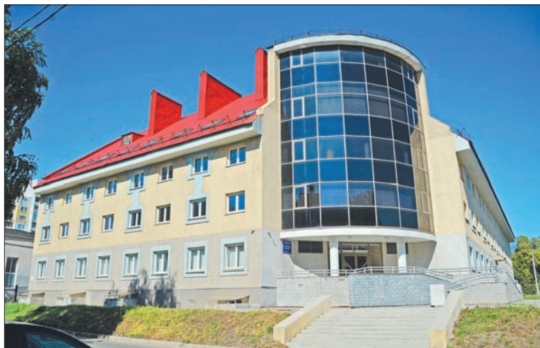
1 сентября 2016 года мы открыли Центр для одаренных детей. Там уже занимаются 212 школьников из Самарской, Пензенской, Оренбургской областей и из Казахстана

Мы делаем все, чтобы материальная база образования отвечала вызовам времени. В 2016 году только в Самаре, как уже говорилось, построены три новые школы: в Волгаре на 1000 мест, в Крутых Ключах на 1360 мест и школа на 1500 мест в Южном городе, которая откроется 1 сентября, но в основном будет сделана уже в этом году. На принципах частно-государственного партнерства построена уникальная школа в Тольятти. Масштабный образовательный центр на 1175 мест открыли мы в Кошках, и другие.